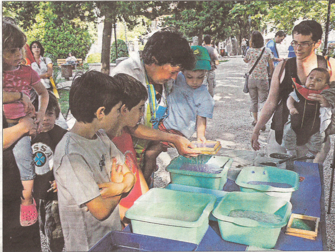
Los licenciados en ciencias ambientales organizaron varias actividades lúdicas en Palma.

La jornada se inició a las seis de la tarde con la realización de varios talleres de papel reciclado, juegos de agricultura ecológica y la construcción de juguetes con materiales reciclados. El acto prosiguió con la proyección de documentales sobre la conservación de la naturaleza, una actuación musical a cargo de Fish Memory y un pisolabis ofrecido por la fundación Amadip-Esment.