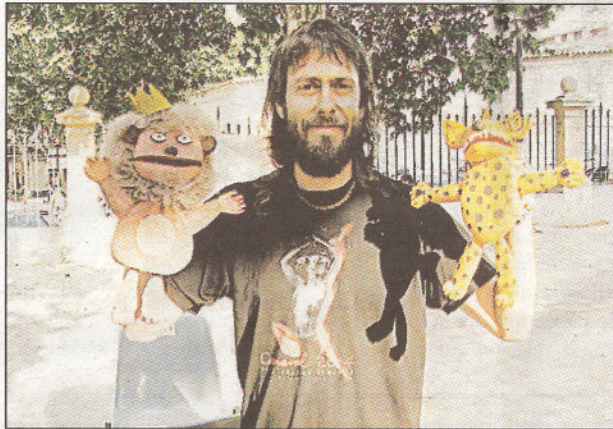
Un espectáculo de marionetas divirtió a los niños.