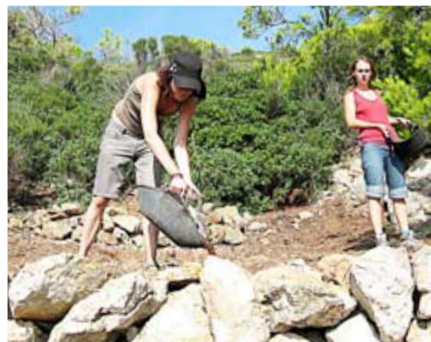
Trabajos junto al muro de 'pedra en sec' recuperado.