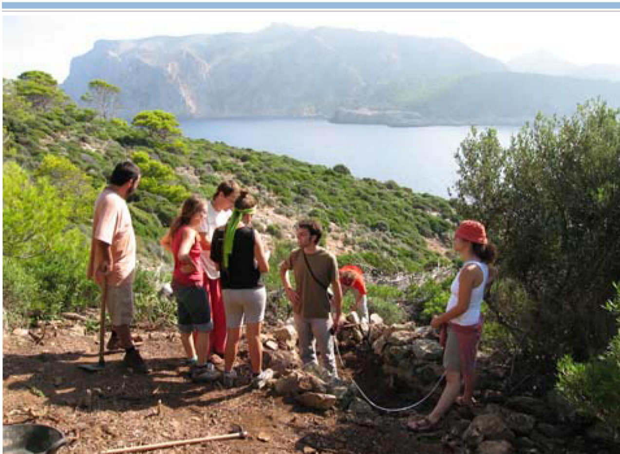
El grupo de voluntarios prepara el croquis de situación de la 'sitja' de carbonero, junto al camí de Tramuntana. S.L.L.